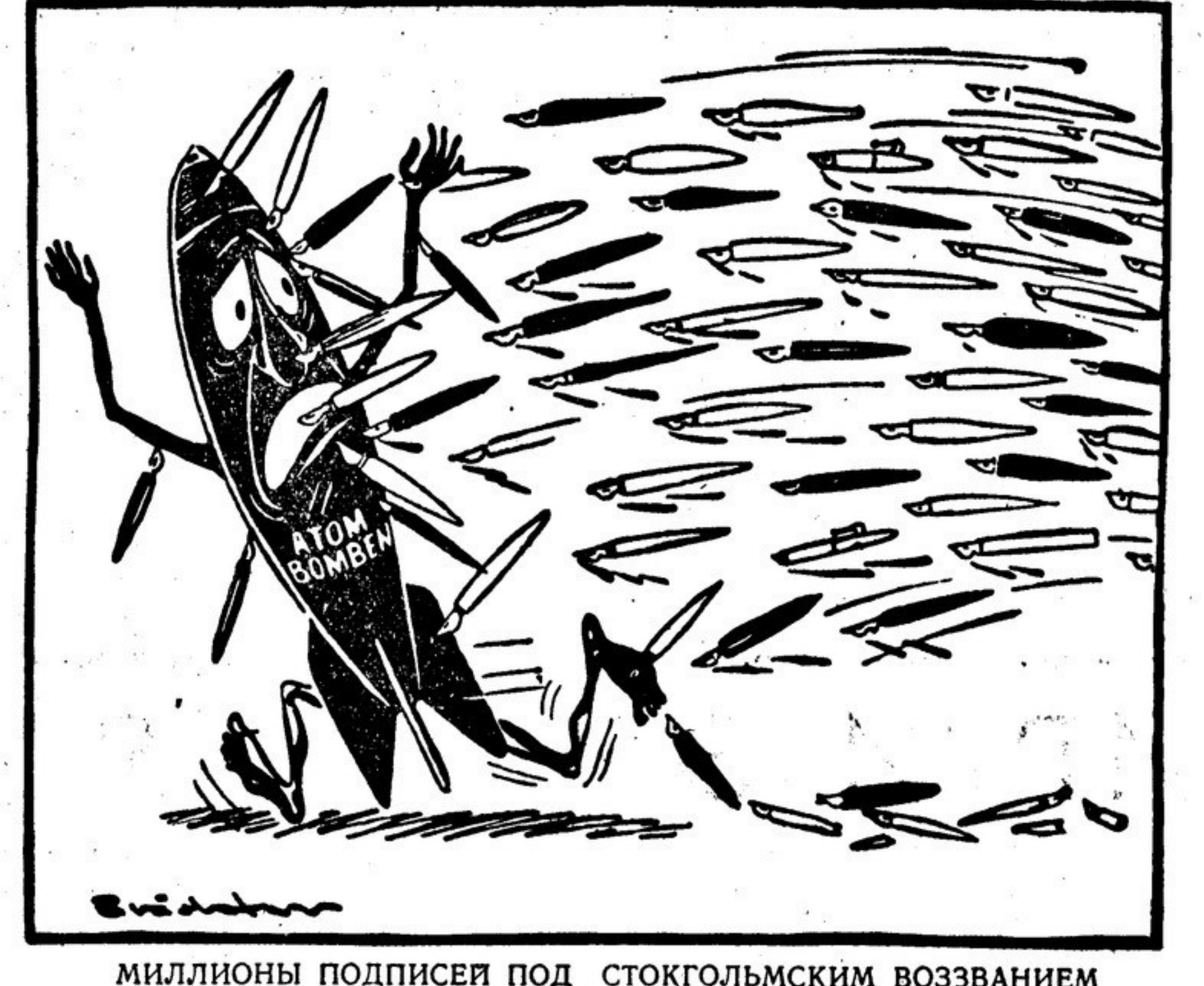
МИЛЛИОНЫ ПОДПИСЕЙ ПОД СТОКГОЛЬМСКИМ ВОЗВРАЩЕНИЕМ УНИЧОЖАЮТ УГРОЗУ АТОМНОЙ БОМБЫ!

Это «парламентское» просвещение очень характерно для нынешнего положения в Африке, где более 150 миллионов человек, подвергавшихся бесчеловечной эксплуатации, колониальному грабежу и насилию, не хотят позволить превратить свои страны в тыловые базы агрессии американских, английских, французских, бельгийских и португальских империалистов.